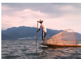
Lac Inle 📍