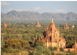
Yangon 📍 ✈️ 520km - ⌚ 1h 20m Bagan 📍