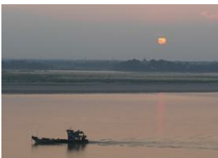
Sur le fleuve Irrawaddy 📍