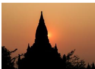
Lac Inle 📍