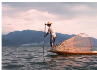
Lac Inle 📍