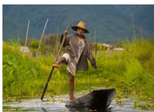
Lac Inle 📍