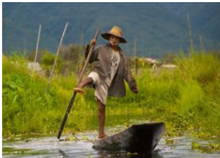
Lac Inle 📍