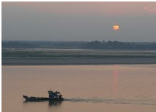
Mandalay 📍 🚗 190km - ⌚ 10h Bagan 📍